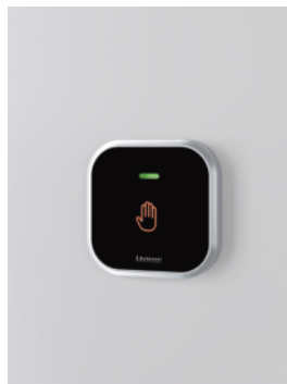
3 操作ユニット W70 × H70 認証距離 100mm