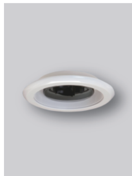
4 在室ユニット φ 156 × H71 認証距離 800mm (直径)