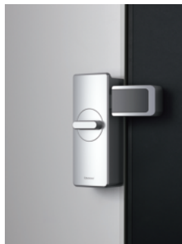
2 施錠ユニット W56 × H141 ラッチストローク 20mm