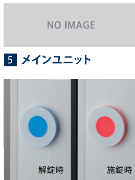
5 メインユニット φ 60 オブション