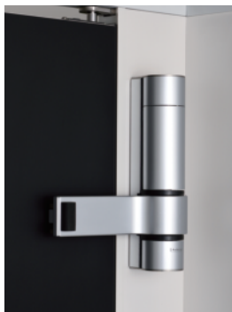
1 開閉ユニット W178 × H229 耐荷重 20kg